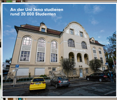
An der Uni Jena studieren rund 20 000 Studenten