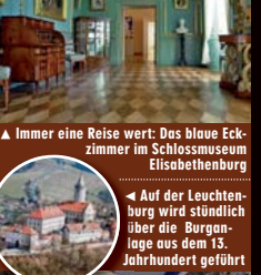
Immer eine Reise wert: Das blaue Eckzimmer im Schlossmuseum Elisabethenburg

Schlösser Sondershausen: Highlight: Die Goldene Kutsche aus dem 18. Jahrhundert. Nur in Stockholm oder Paris gibt es solche Staatskarossen zu bestaunen.