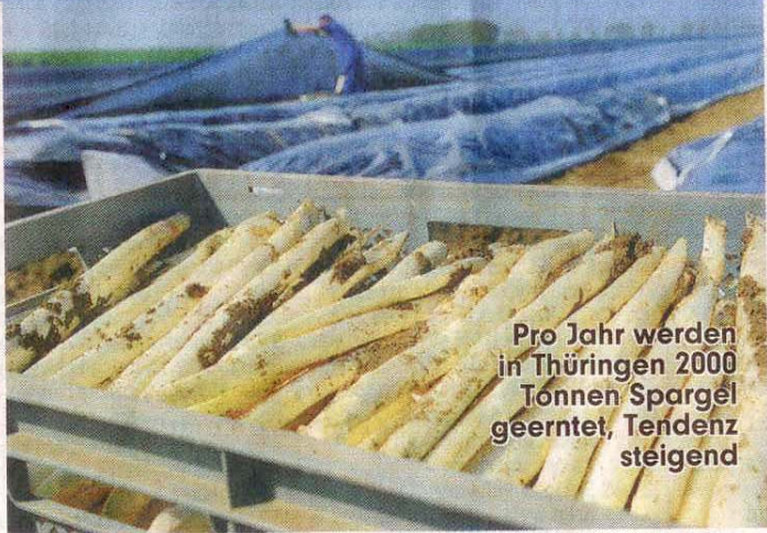
Pro Jahr werden in Thüringen 2000 Tonnen Spargel geerntet, Tendenz steigend